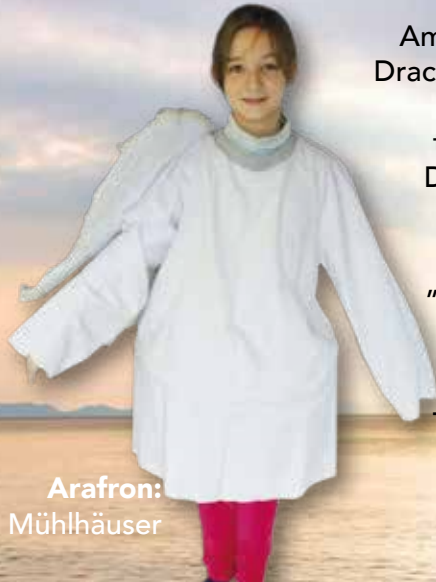
Arafron: Elina Mühlhäuser

Arafron gibt Tabaluga schließlich den Tipp, auf seiner Suche nach der Vernunft die uralte Meeresschildkröte Nessaja zu befragen und bringt ihn ans Meer. Unterwegs beobachten sie eine Gruppe Delphine, die sich einfach ihres Daseins erfreuen und das Leben genießen.