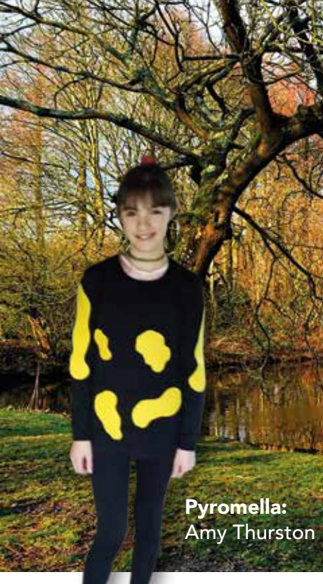
Pyromella: Amy Thurston

Als er das Feuersalamanderweibchen Pyromella kennenlernt, muss Tabaluga feststellen, dass sie beide sich zwar ähnlich sind, aber dennoch nicht zueinander passen. Pyromella erklärt ihm, dass es trotzdem möglich ist, den anderen zu respektieren und nicht als Feinde auseinanderzugehen.