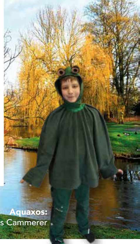
Aquaxos: Hannes Cammerer

In der Kaulquappenschule wird frei nach dem Wahlspruch „Werde Frosch, aber sei kein Frosch“ unterrichtet. Auch hier lernt Tabaluga allerhand dazu, der Unterricht wird jedoch blitzschnell beendet, als der Storch Arafron auftaucht.